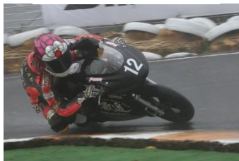
3位 とりおギャラクシー