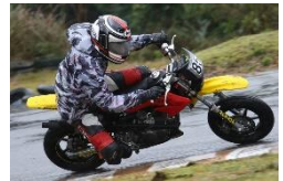
4位 日暮 泰智