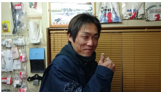
Kinki Sports Land Road Race Series 2017 M-GP class 2017 Series Champion UNO-P ★

ここまで来たからこそ勝ち続けられるか頑張ってみようと思いましたが、サポートして下さる方々や応援して頂いている方々の協力があったからこそレースをやれているので本当に感謝です。開幕戦は無難に勝てる事が出来たけど、レースを長くやっている色々な事があるもので、お天気に苦戦した印象が強いですが、ウエットレースは苦手ではないけれど、微妙なコンディションでのセットや展開が読めないのが苦戦しました。結果的に何とかチャンピオンを獲得出来たから良かったものの、改めてレース何が起るかわからないと思いましたが、でも、それがレースの醍醐味でもあるし辛い所でもあるんだけど...今シーズンも楽しみつつ全力で頑張ります!!