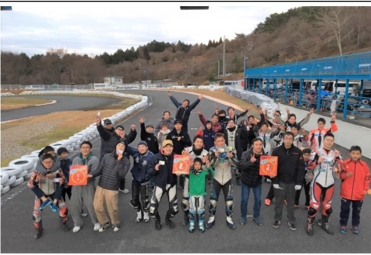
水曜モギー → 南海部品京都東 present's 水曜モギー 土曜モギー → ライコランド present's 土曜モギー

これにより、さらに模擬レースながら選手のモチベーションを上げる要因となる事間違いなし!4月開催からスタート予定なので、皆さん開催日はどんどんエントリーよろしくお願いします(笑)