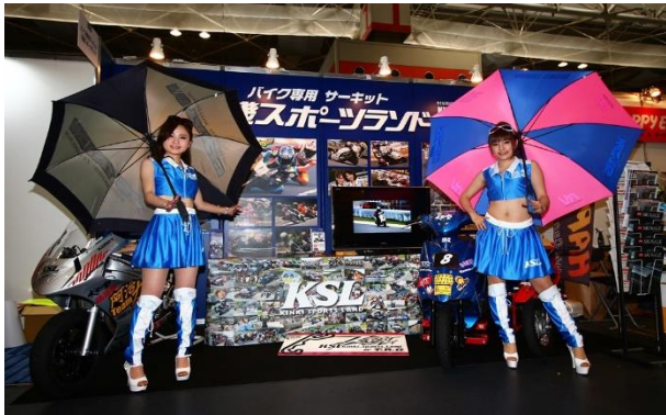
2015年 大阪モーターサイクルショー 近畿スポーツランドブース