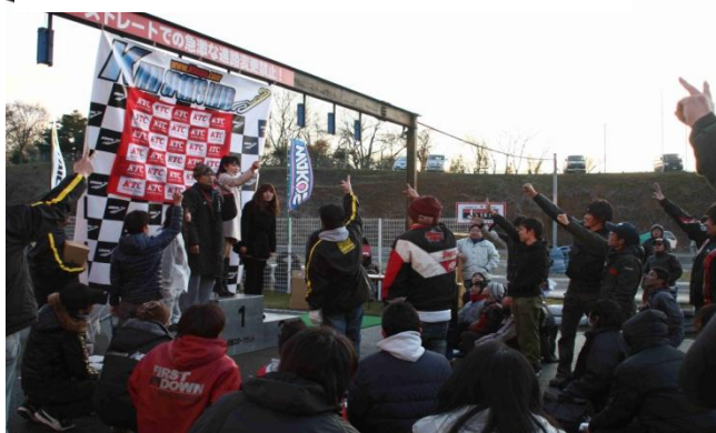
表彰式後はKTC工具箱を始め、豪華賞品の抽選会&ジャンケン大会 写真下