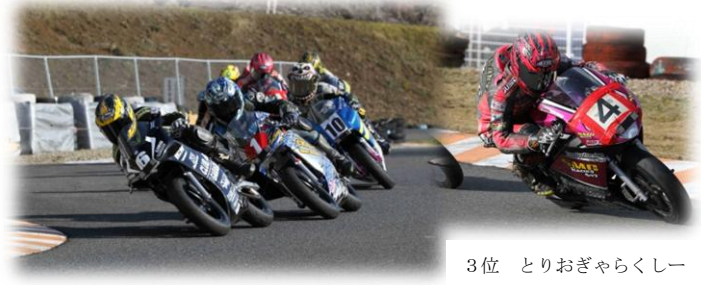
3位 とりおぎやらくしー