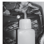
燃料キャッチタンク