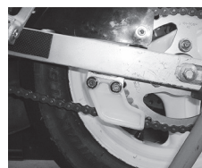
リアスプロケットガード