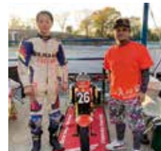
A→R真加部レーシング