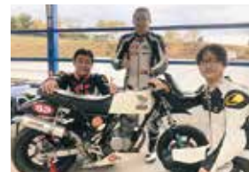
妹子パトロール隊 with ロティ