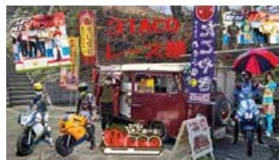
3 TACO レース部