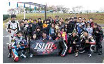
イシイモーターサイクル1号機