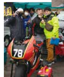
うさぎとかめ。 トシチャンズ