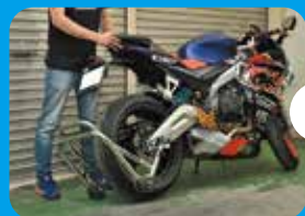
⑤バイクを両手で直立させる。 左足(軸足)は車輪のところ。 ここが立ち位置。 これ、とっても重要。