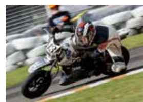
ホワイトラビット エンデュランス