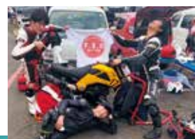
フライングサンクラブ