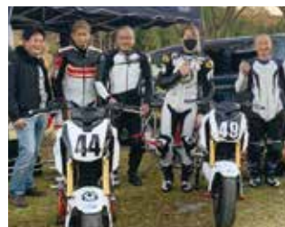
ルナ with しゃんぺんしゃわあ