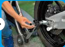
②高さは2段目に調整し、 幅を適度に調整する。