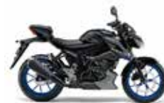
タイタンブラック (YVU)

GSX-S125 ABS メーカー希望小売価格 (消費税10%込み) ¥420,200 (消費税抜き¥382,000)