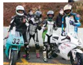
HOPPER with 核弾頭(左)、Ot's(右)