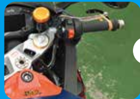
①ブレーキレバーを、何かで ロックする。ステアリングは 必ず 左いっぱい に切る。