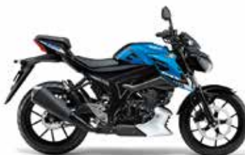
トリトンブルーメタリック/タイタンブラック (BGY)