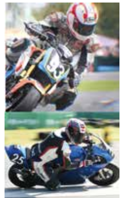
KM II ☆VEGASPORTS