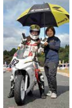
チームくすもと家