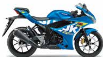
トリトンブルーメタリック (YSF)