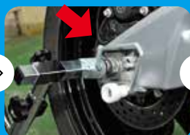
④反対側はこのようなってます。