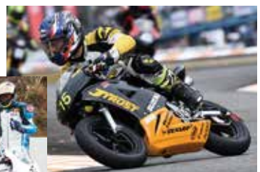
KENZ Jトラストベイビー