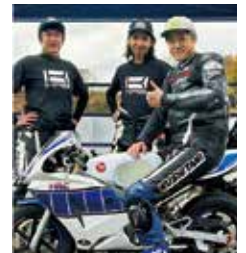
KRB WEST B