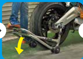
⑥ここでシートベルトかタンデムグリップを左手で持ち、右手はさらに 後ろあたりに手を添え、右の車輪が地面に付くまでバイクを 起こすスタンドの一番後端を踏み、シートカウルとスタンドを 引き離すようにもぐり込ませる。