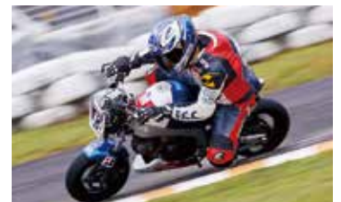
ホワイトラビットエンデュランス