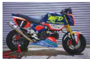
MFD 大阪 GROM5