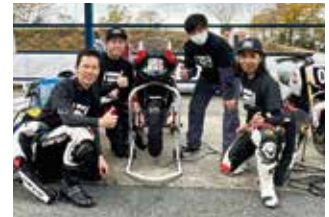
KRB WEST A