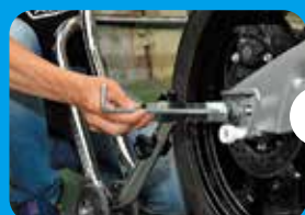
③シャフトで貫通させます。最後までしっかりと貫通させます。